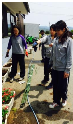
＜電気量削減＞グリーンカーテン設置