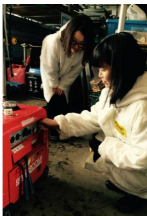
＜事務社員による避難訓練＞