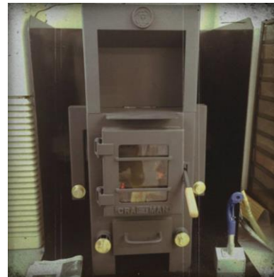
＜電気量削減＞薪・ペレット兼用ストーブ