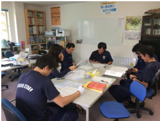
＜環境委員会ミーティングの様子＞