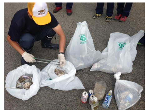
＜地域貢献＞周辺清掃活動