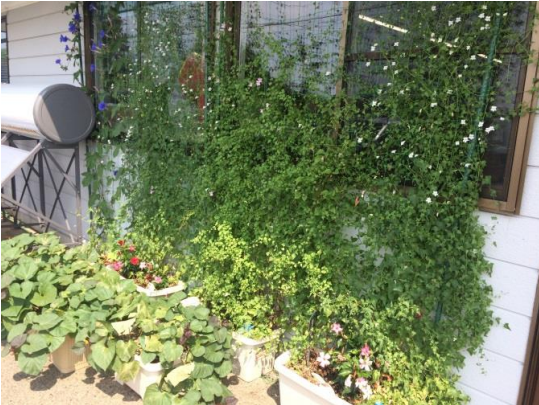
＜電気量削減＞グリーンカーテン設置