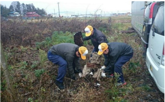
＜地域貢献＞周辺清掃活動