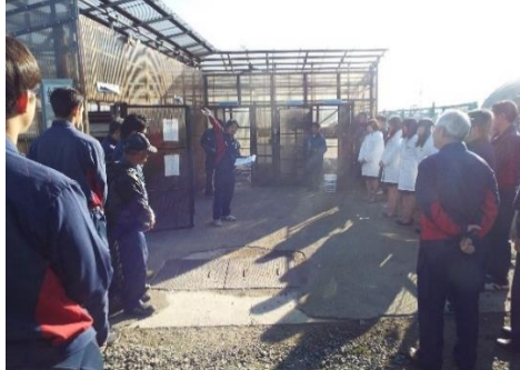
＜社員教育＞事務所内